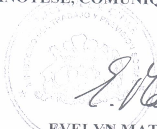
EVELYN MATTHEI FORNET Ministra del Trabajo y Previsión Social.